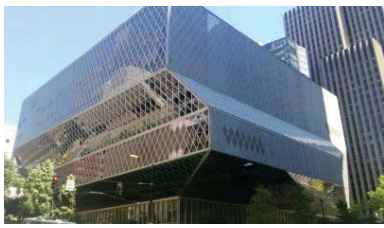
【シアトル公共図書館】