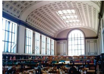
【カリフォルニア大学バークレー校】

2015年のALA総会は、サンフランシスコにて開催されました。研修は2015年6月23日～30日に行われ、シアトルとサンフランシスコを巡り、アメリカ図書館界の最前線の現場を視察・体感することができました。