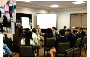
【ALA関係者とのミーティング】