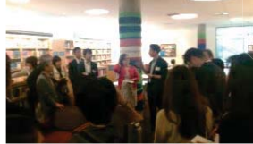
【マイクロソフト社図書室】