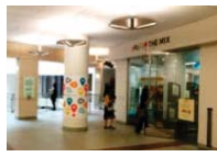
【サンフランシスコ公共図書館】