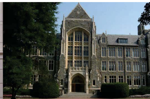
"George Washington University"