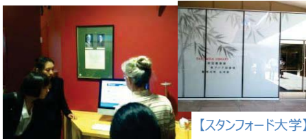
【スタンフォード大学】